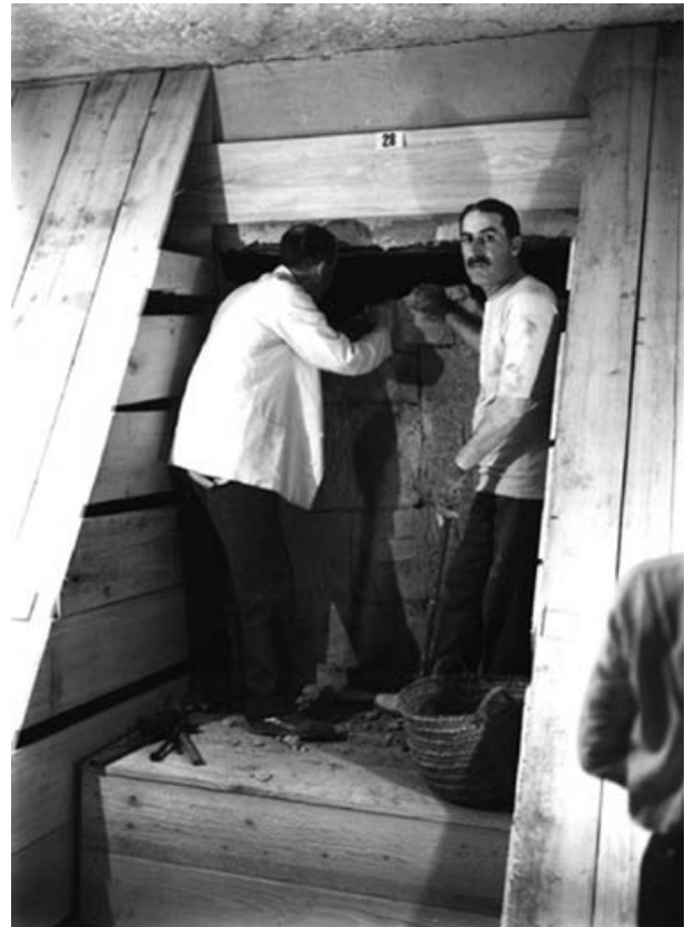
Howard Carter bei den Arbeiten an der Grabkammer

Tutanchamuns entdeckt zu haben. Bereits am 30. November 1922 erschien der erste Artikel über die Entdeckung des Grabes in der englischen Tageszeitung The Times . Die Entdeckung wurde weltweit in den Medien als Sensation gefeiert. Sofort stellte Howard Carter ein Team von Experten zusammen. Die Kammern wurden vollständig wissenschaftlich katalogisiert und ausgeräumt. Das dauerte 10 Jahre. In der Ausstellung „Tutanchamun – sein Grab und die Schätze“ sind die Grabkammern so dargestellt, wie sie Howard Carter und Lord Carnarvon bei ihrer Entdeckung vorfanden.